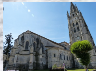
La basilique St Eutrope