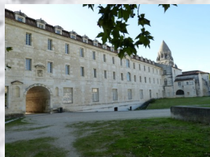
L'abbaye aux Dames