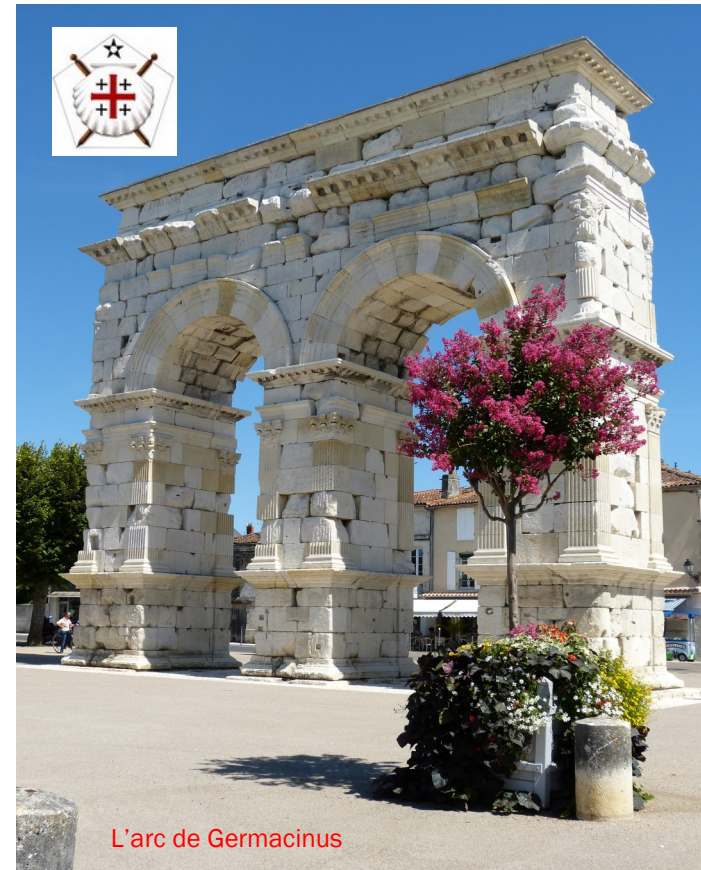
L'arc de Germacinus